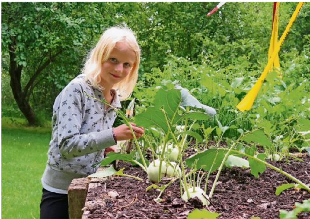
Hier gibt es was zu entdecken: Gemüse aus dem Bauernhof-Garten ...